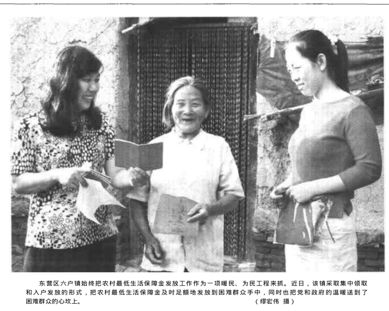
东营区六户镇始终把农村最低生活保障金发放工作作为一项暖民、为民工程来抓。近日，该镇采取集中领取和入户发放的形式，把农村最低生活保障金及时足额地发放到困难群众手中，同时也把党和政府的温暖送到了困难群众的心坎上。（缪宏伟 摄）

等三个供电所在全县开展的“三级联创”活动中，被广饶县委授予“群众满意的基层站所”称号。（孙红军）