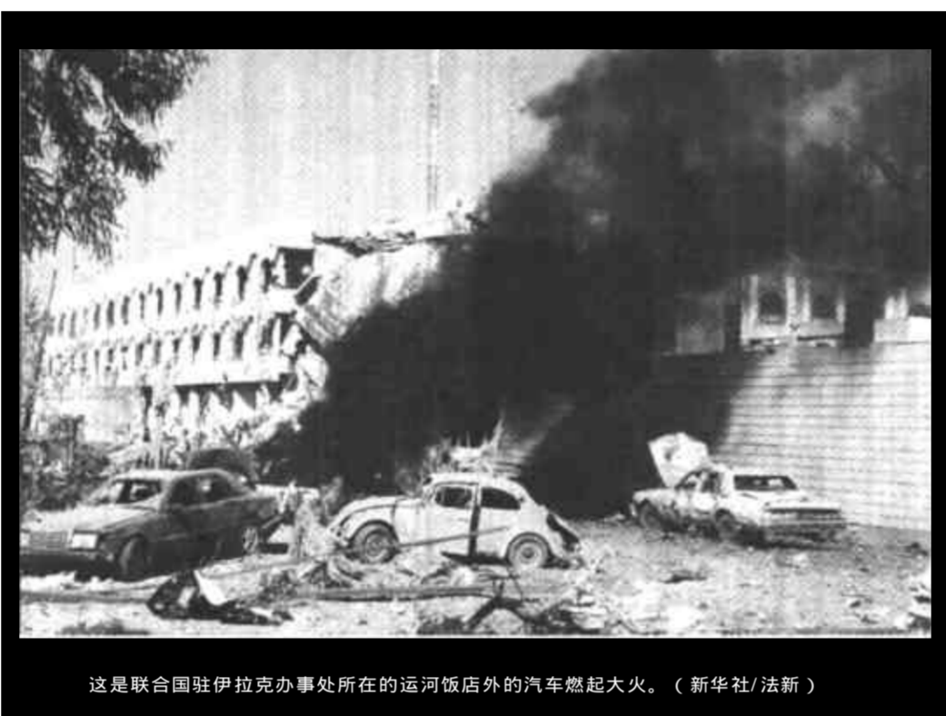
这是联合国驻伊拉克办事处所在的运河饭店外的汽车燃起大火。