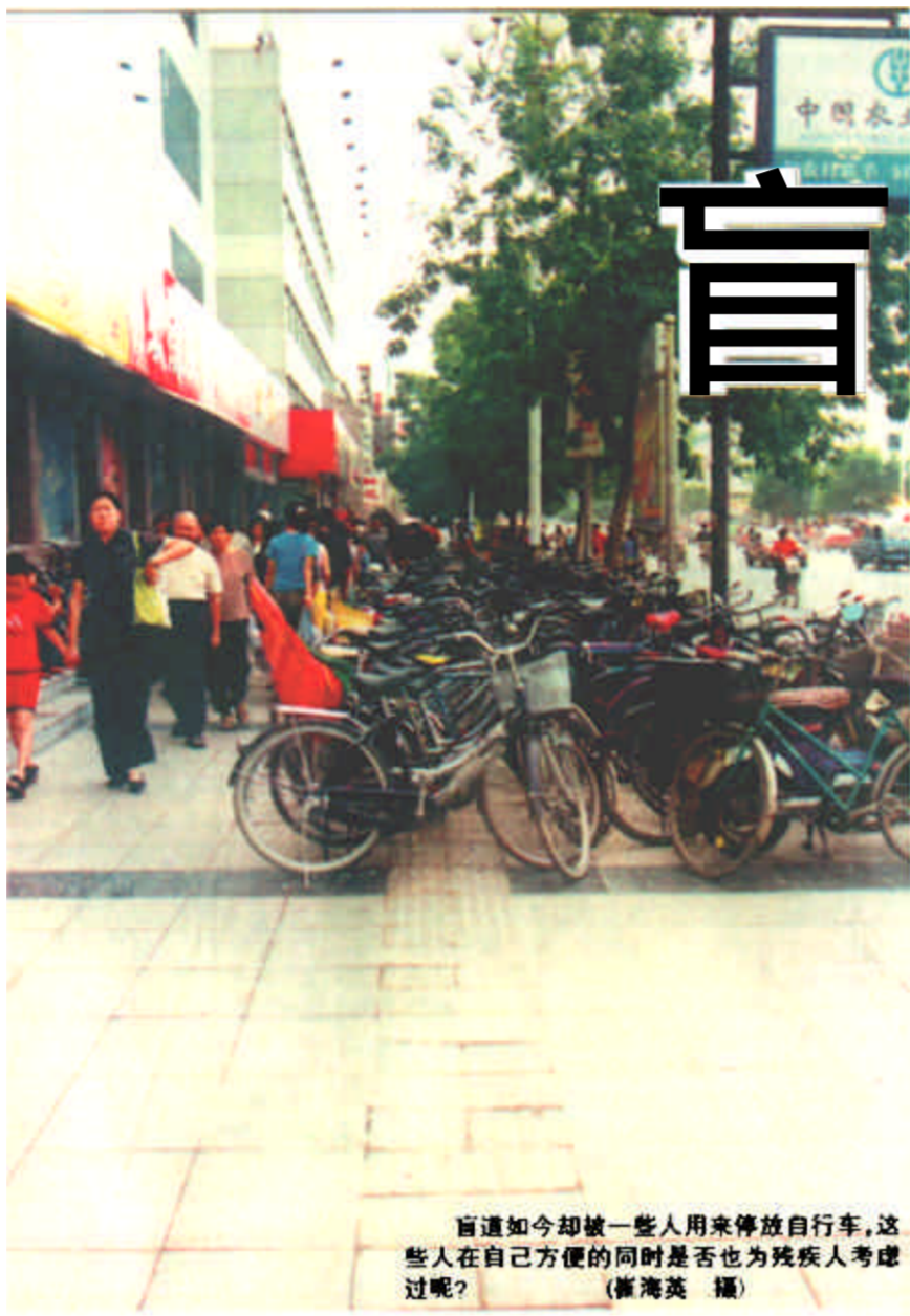
盲道如今却被一些人用来停放自行车，这些人在自己方便的同时是否也为残疾人考虑过呢？